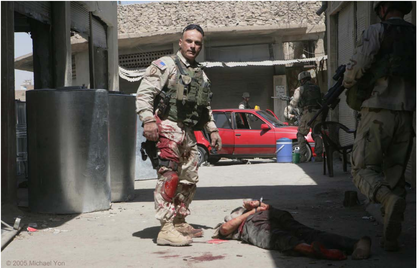
(ภาพบน) เอลิคอปเตอร์ลงจอดในฐานทัพที่เฮลแมนด์, อัฟกานิสถาน (2009) ในขณะที่ ย. ลดเพดานบินเพื่อลงจอด ลมจะดูดเศษฝุ่นขึ้นทำให้เกิดประกายบนใบพัด มันไม่เคยมีชื่อ สำหรับปรากฏการณ์เช่นนี้มาก่อน ไมเคิลเรียกมันว่า Kopp-Etchells Effect ตามชื่อของทหาร สองนายที่เพิ่งเสียชีวิตไปเมื่อไม่นานมานี้ และกลายเป็นชื่อติดปากที่เรียกขานปรากฏการณ์เช่นนี้ (ภาพล่าง) ทหารอเมริกันหลังจากการต่อสู้มือเปล่ากับผู้ก่อการร้ายในโมซูล, อิรัก (2005)